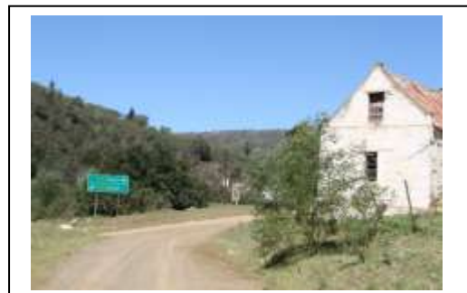
'n Foto van die Vlugt, soos dit vandag lyk.